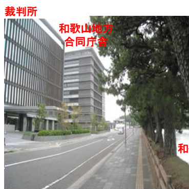
和歌山地方合同庁舎