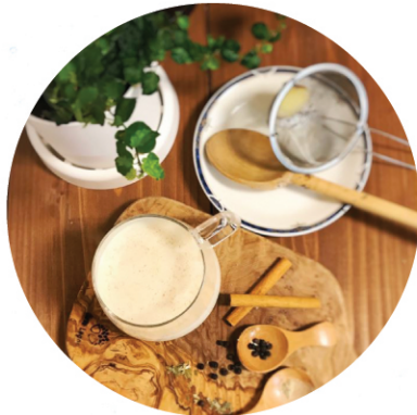
※写真はイメージ画像です